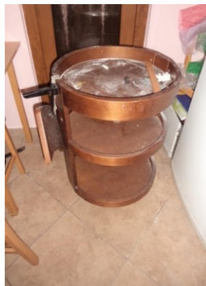
Rasklimani i neupotrebljiv poslužavnik za piće u ostavi