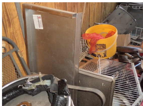
Rashodovane pozicije van upotrebe