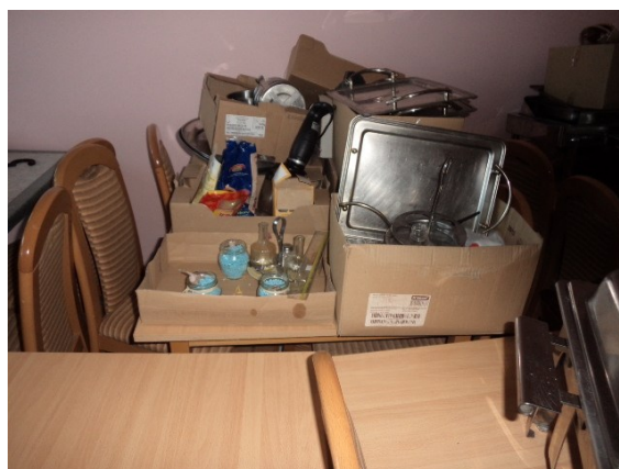
Rashodovane pozicije van upotrebe