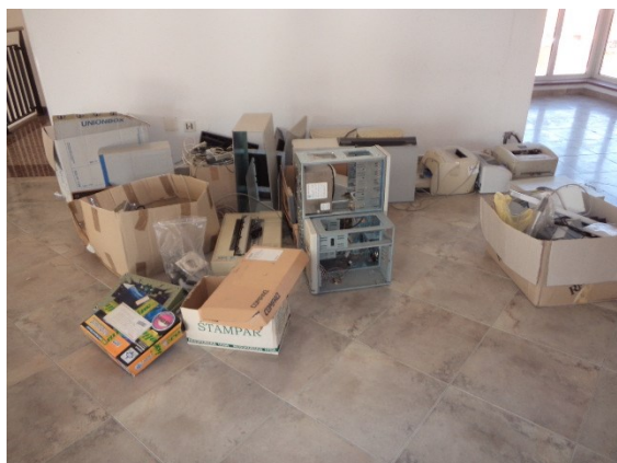
Pozicije informatičke opreme van funkcije, jer je tehnološki zastarjelo

Značajni broj pokretnina iz zbirne liste, njih 38, nisu u stanju koje bi bilo prihvatljivo za korištenje, ili za dovođenje u stanje za moguće korištenje. To su dotrajale pozicije ili su u trajnom kvaru ili su polomljene i nisu popravljive. Veći dio njih je već prethodno rashodovan, ali nije isknjižen, pa je ostao u inventurnoj evidenciji stečajnog dužnika. U nastavku je snimkama prezentirano nekoliko primjera takvih pozicija.