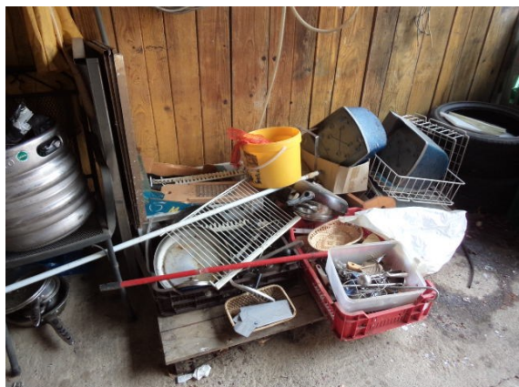
Rashodovane pozicije van upotrebe